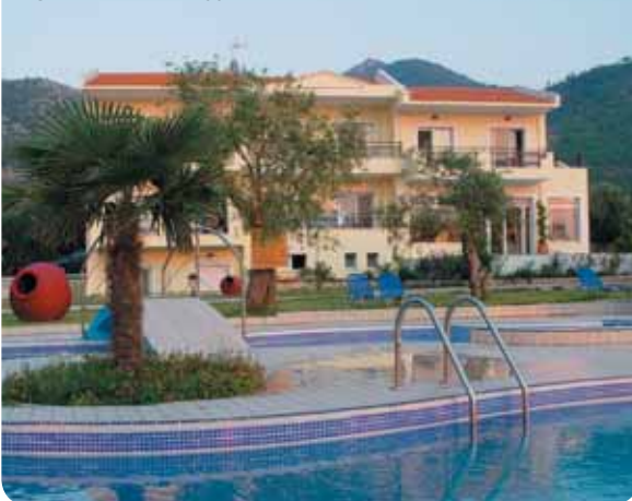
HOTEL VILLA NATASSA