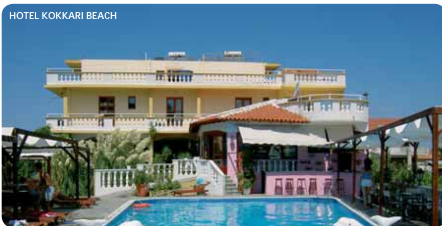
HOTEL KOKKARI BEACH