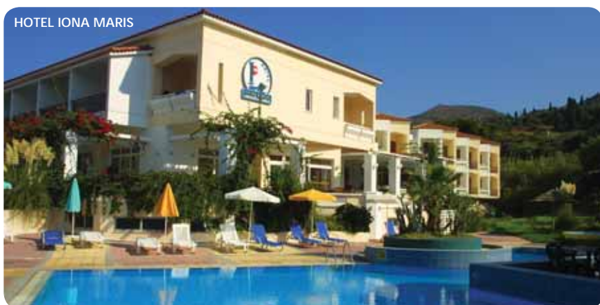
HOTEL IONA MARIS