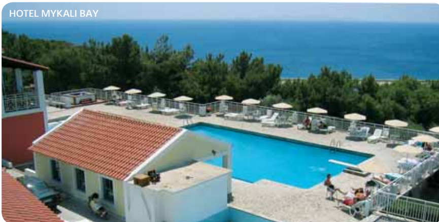
HOTEL MYKALI BAY