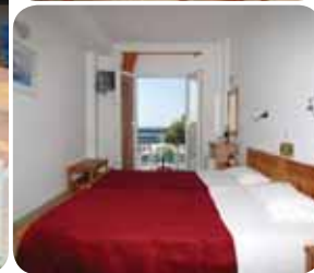
HOTEL IREON BEACH