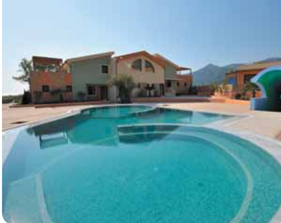
HOTEL ALEXANDRA GOLDEN THASSOS BOUTIQUE