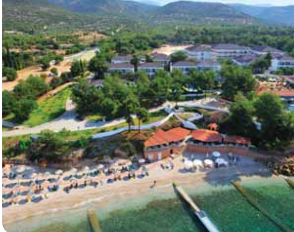
HOTEL ALEXANDRA BEACH THASSOS SPA RESORT