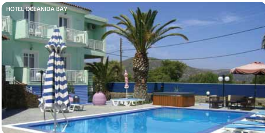
HOTEL OCEANIDA BAY