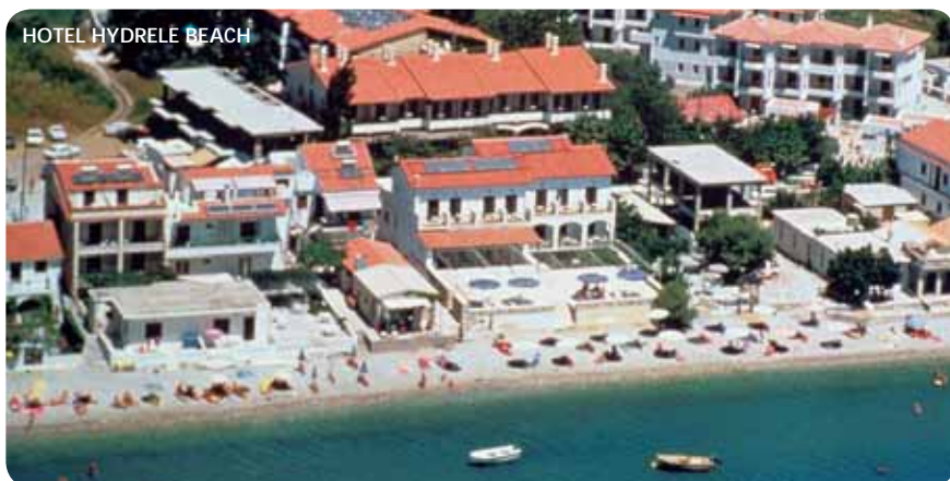
HOTEL HYDRELE BEACH