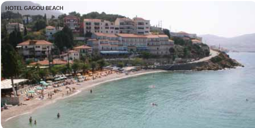
HOTEL GAGOU BEACH

P.S.: è previsto il secondo letto per i bambini fino ai 6 anni.