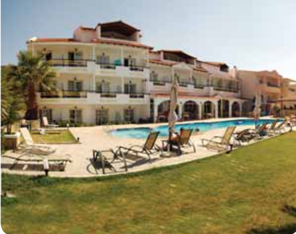
HOTEL RACHONI RESORT