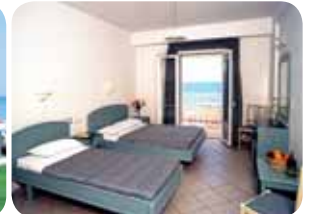
HOTEL SMARAGDINE BEACH