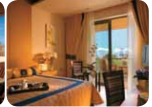
HOTEL GOLDEN SUN