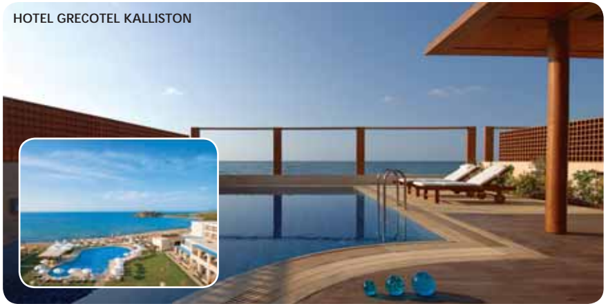
HOTEL GRECOTEL KALLISTON