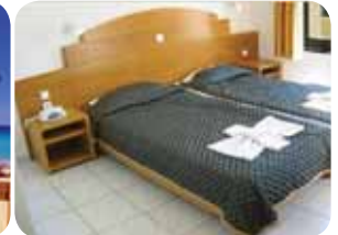
HOTEL SANTA MARINA BEACH