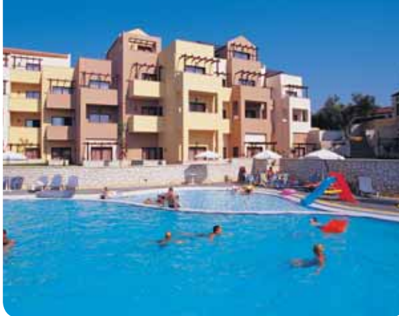
HOTEL ALTHEA VILLAGE