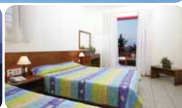
HOTEL CACTUS BEACH