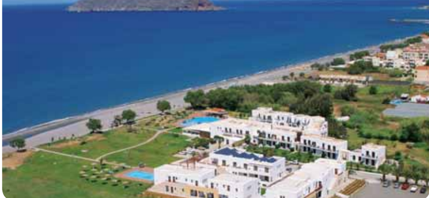
HOTEL GERANIOTIS BEACH