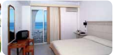
HOTEL ARIADNE BEACH