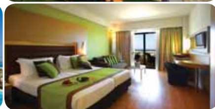
HOTEL THALASSA BEACH RESORT