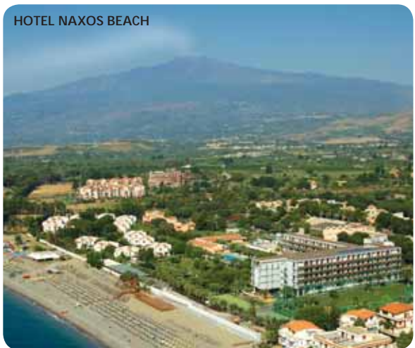
HOTEL NAXOS BEACH