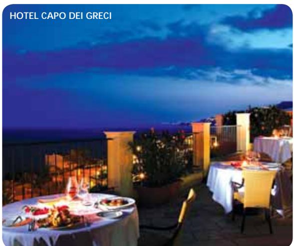
HOTEL CAPO DEI GRECI

Servizio: ricca prima colazione e cena a self service. Nostro giudizio: ****