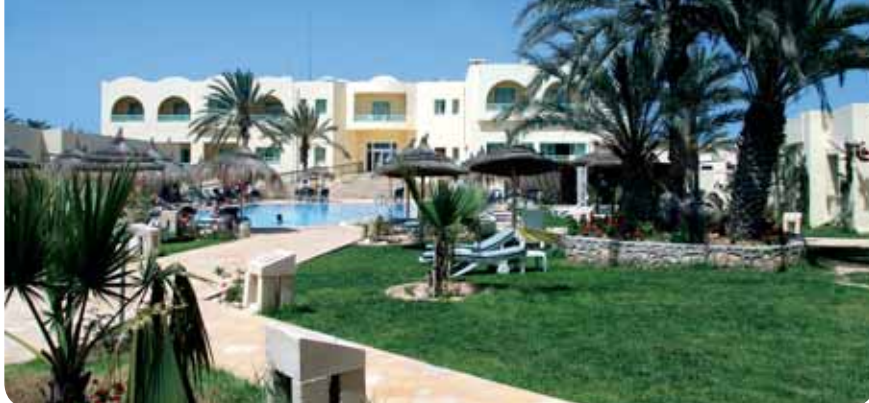
HOTEL DIAR YASSINE