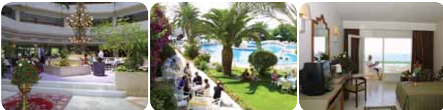
HOTEL LE KHALIFE