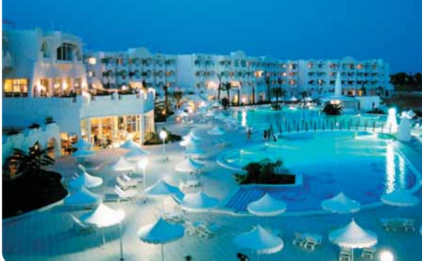
HOTEL VINCCI ALKANTARA THALASSA