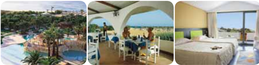
HOTEL SOL AZUR BEACH