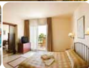
HOTEL SPRINCLUB DJERBA GOLF