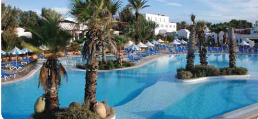
HOTEL LAICO DJERBA