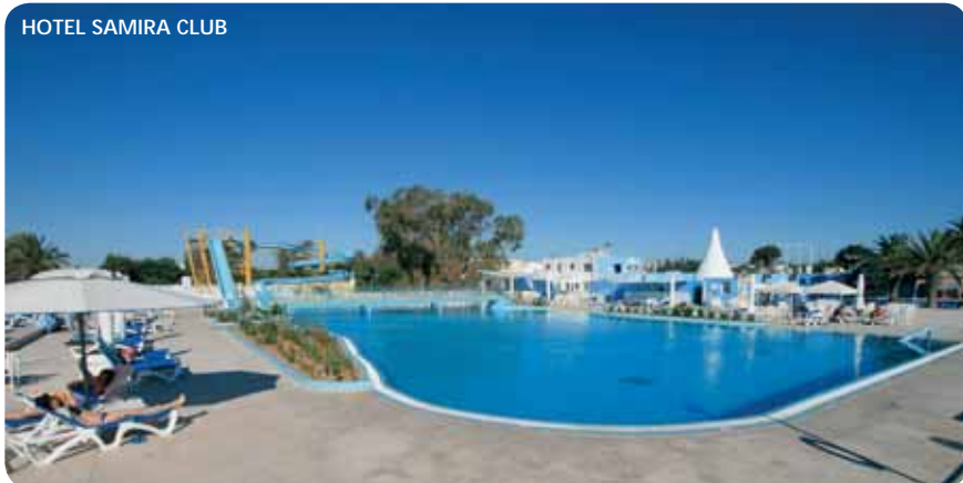
HOTEL SAMIRA CLUB