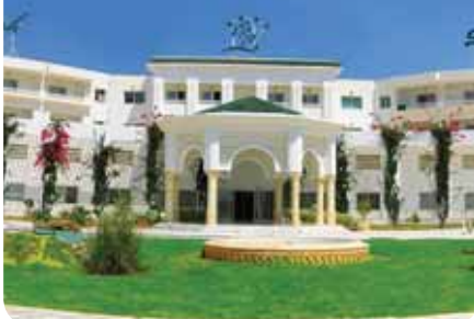
HOTEL PRIMA LIFE IMPERIAL PARK

Nota: l'albergo si trova nelle immediate vicinanze di numerosi locali e discoteche.