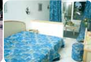
HOTEL BEL AIR