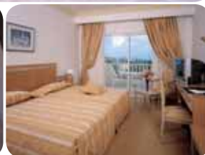
HOTEL GARDEN PARK