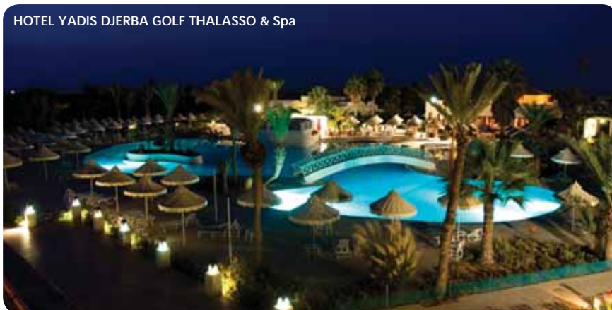
HOTEL YADIS DJERBA GOLF THALASSO & Spa