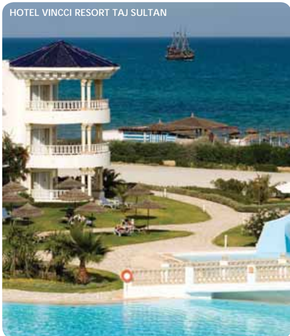
HOTEL VINCCI RESORT TAJ SULTAN