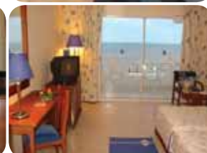
HOTEL LTI DJERBA HOLIDAY BEACH