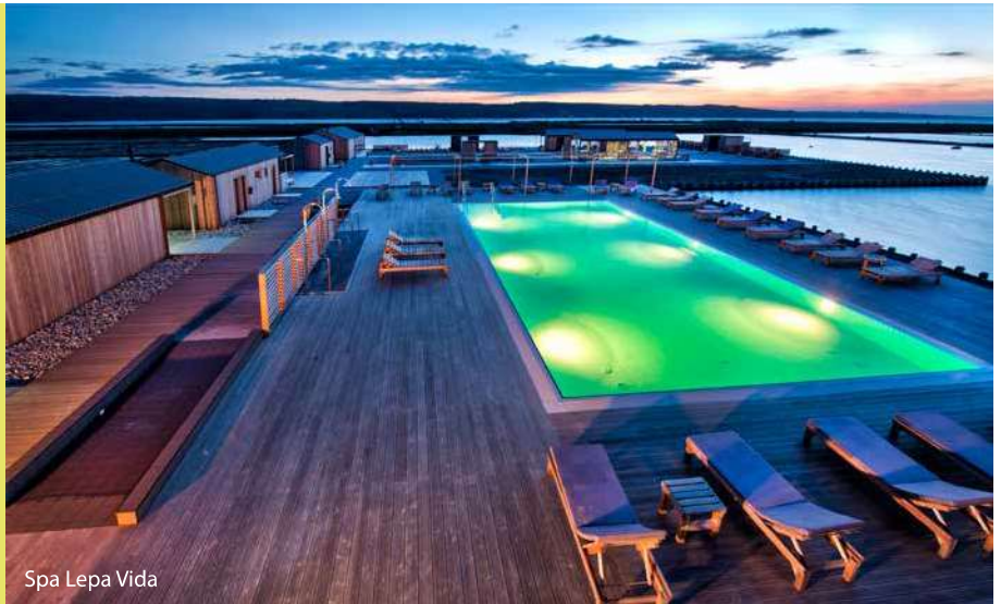
Spa Lepa Vida

BRANZINO DI PIRANO: nel golfo di Pirano si trova l'allevamento ittico Fonda che si occupa