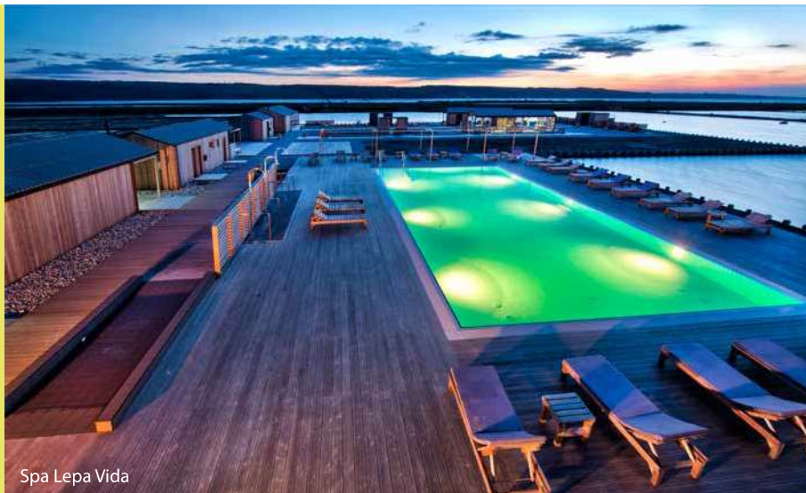
Spa Lepa Vida

BRANZINO DI PIRANO: nel golfo di Pirano si trova l'allevamento ittico Fonda che si occupa